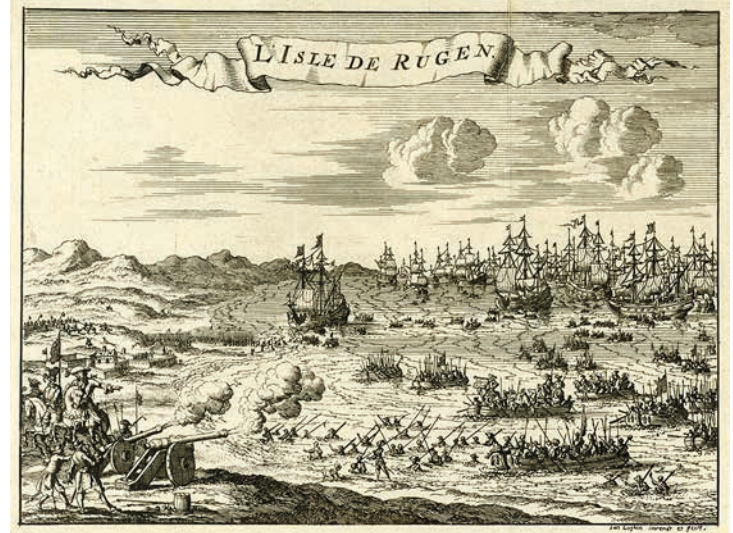
Beschuss der brandenburgischen Truppen durch schwedische Artillerie, 1678