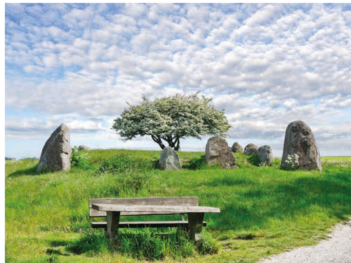
Das eindrucksvollste Großsteingrab ist der Riesenberg bei Nobbin auf Wittow