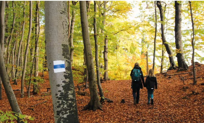
Im Nationalpark Jasmund erlebt man uralte Buchenwälder

Boddengewässer, Dünen, Steppenrasen und eiszeitliche Hügel so unmittelbar aufeinander. Diese Vielfalt schafft eine reiche Tierwelt: Neben Seeadlern und Kranichen sind auch Rotwild, Füchse, Dachse und zahlreiche Fledermausarten heimisch. In den Küstengewässern leben Kegelrobben und mit etwas Glück lassen sich Schweinswale beobachten.