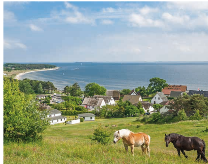
Auch das ist Rügen: Liebliche Hügellandschaft auf dem Mönchgut

Sagenhafte 65 Prozent der Landfläche Rügens stehen unter Naturschutz, darunter: zwei Nationalparks, ein Biosphärenreservat und 28 Naturschutzgebiete. Unter Schutz gestellt wurden die Gebiete noch in den letzten Tagen der DDR. In den Großschutzgebieten wird nicht nur Natur konserviert und gepflegt. Sondern Gäste wie Einheimische sollen an die Natur herangeführt werden. Dazu zählen neben Informationszen-