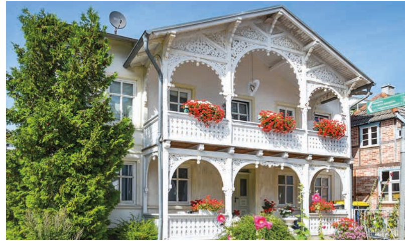
Typisch für den Bäderstil sind verzierte Balkone

Neben der Bäderarchitektur fallen auf Rügen noch viel ältere Bauten ins Auge: die imposanten Kirchenbauwerke der Backsteingotik . Nach der Christianisierung durch die Dänen um das Jahr 1170 entstanden auf Rügen etliche mächtige Kirchen im Stile der Backsteingotik, die bis heute Zentrum und Landmarke vieler Gemeinden sind. Die Marienkirche in Bergen (► Seite 43), die Marienkirche in Waase (► Seite 150) und die Johanneskirche in Schaprode (► Seite 153) sind nur einige Beispiele. Sie gehören zu den ältesten Bauwerken Mecklenburg-Vorpommerns.