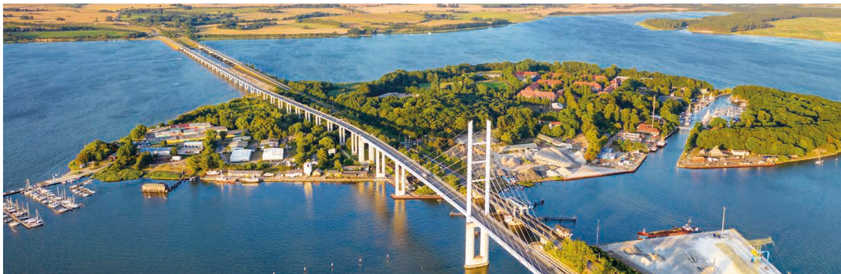
Die 2007 eröffnete Rügenbrücke überquert die Insel Dänholm

Häfen gibt es auf Rügen, davon 22 Sport- und Yachthäfen.