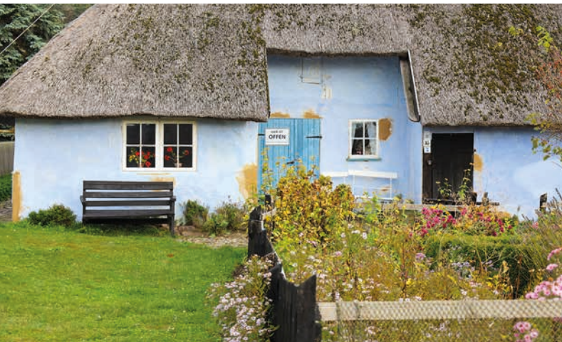
Das Pfarrwitwenhaus in Groß Zicker wurde 1720 erbaut

Herausragende Bauten des 20. Jahrhunderts sind das unvollendete KDF-Seebad in Prora (► Seite 70) aus der NS-Zeit und die futuristisch anmutenden Bauwerke des „Inselbaumeisters“ Ulrich Müther (► Seite 22). Eines seiner bekanntesten Projekte ist der Rettungsturm in Binz, genannt Ufo (► Seite 63).