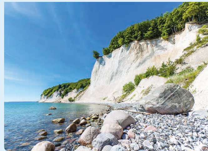
Kreideküste im Nationalpark Jasmund

Nachdem ein Teil der Eismassen geschmolzen war, stieg der Meeresspiegel an. Die Ostsee bildete sich und die Erhebungen Rügens ragten aus dem Wasser. Wind und Gezeiten veränderten die Küsten – sie verliehen der Insel ihre heutige Struktur. Bodden, Nehrungen und lange Sandstrände entstanden, etwa an der Schaabe zwischen Jasmund und Wittow.