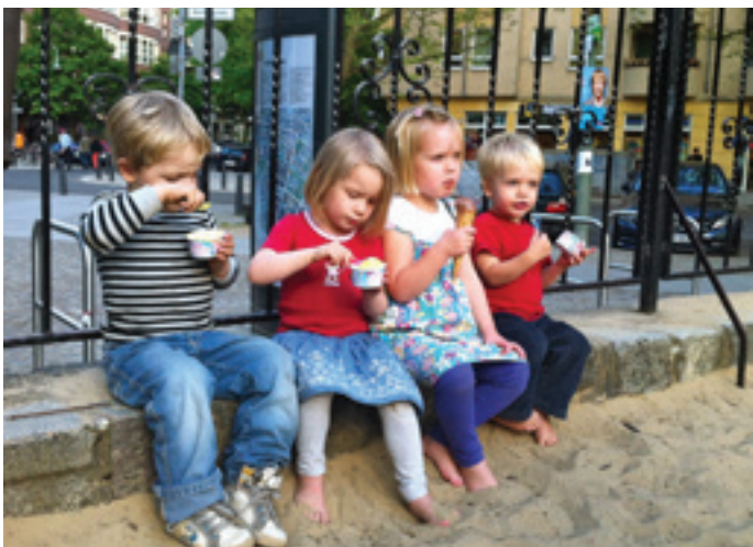
Toben und spielen macht hungrig – da ist ein Eis für die Pause genau das Richtige