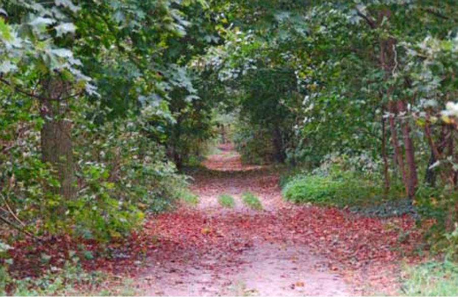
Wanderweg nach Teltow

Truppen besiegten unter General von Bülow die napoleonischen Truppen vor den Toren Berlins. Dadurch verhinderten sie die Besetzung der preußischen Hauptstadt. Die Ausstellung im Turm gibt mehr Informationen über diesen Teil der Geschichte. Vor allem lohnt sich aber ein Turmaufstieg, denn von dort oben hat man einen wunderschönen Ausblick über die Landschaft.