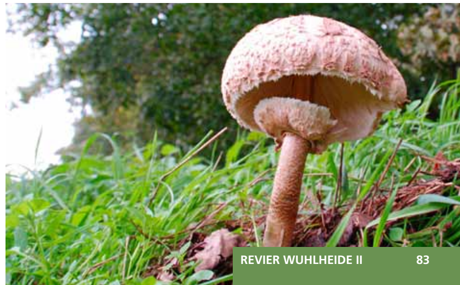
Kleine Schönheit am Wegesrand

Zum S-Bahnhof Lichterfelde Süd biegt man nach Westen (links) ab, unter den beiden Bahntrassen hindurch. Der asphaltierte Weg macht einen Schlenker nach Süden (links). Dort geht es jedoch nicht weiter. Man geht geradeaus bis an den Zaun und dort ist rechts plötzlich ein kleiner Durchgang zu sehen. Dieser wird genutzt, und auf dem schmalen Pfad wird der Westfalenring erreicht. Ein Stück weiter geradeaus nach Norden ist schon der S-Bahnhof Lichterfelde Süd erreicht.